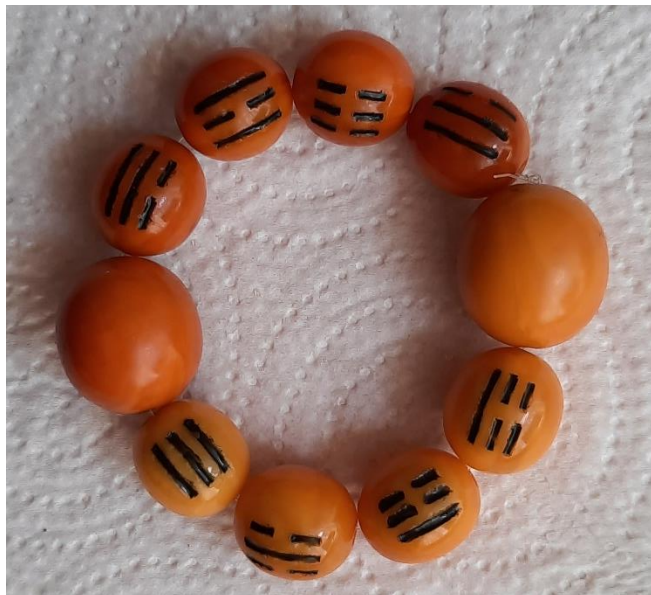
Рис. 3. Фотография четок.

Янтарные чётки с триграммами по Вэнь-вану изображены на рис. 3.