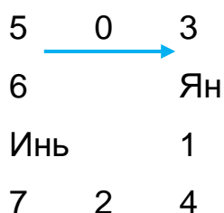
Рис. 2. Схема чётков.

Если схему чётков изобразить в виде десятичных эквивалентов двоичных значений триграмм, то она будет выглядеть так (рис. 2).