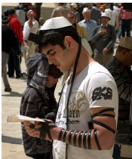
Рис. 3. URL: http://websights.info/purpose-of-resume/

Можно указать на иную версию, связанную с Торой. Известно, что иудеи при осуществлении молитвы привязывают две коробочки с текстами из Торы (тфилин) на голову и левую руку. Раввины объясняют это тем, что левая рука ближе к сердцу, а коробочка на голове ближе к разуму. Это связано с тем, чтобы согласовать желания и мысли с любовью к Всевышнему (рис. 3).