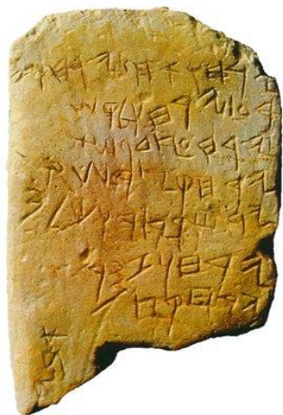
Рис. 1. URL: https://pravoslavnaya.academic.ru/6782

Самые древние надписи на иврите («календарь из Гезера»), найденные в Израиле, в виде известняковой таблички (11.1*7.2 см.) с нацарапанными буквами насчитывают почти 3000 лет (рис. 1).