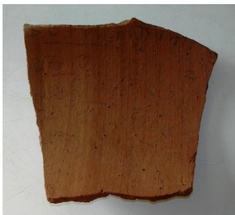
Рис. 2. URL: http://litbook.ru/article/9909/

Возможна и иная версия, связанная с написанием текстов на наиболее простых носителях: папирусе, пергаменте при свете восходящего Солнца с левой стороны или при свете светильника ночью, который ставили на восточной стороне имитируя Солнце. Тривиальные технологические версии происхождения написания текста на иврите не выдерживают критики.