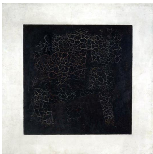
Рис. 1. К. Малевич, Картина «Черный Супрематический Квадрат», 1915 г. С-Петербург. Холст, Масло. 79,5 × 79,5 см. Государственная Третьяковская галерея, Москва.

Насколько нам известно, К. Малевич не расшифровал ни идею, ни сам знак этой картины (рис. 1).